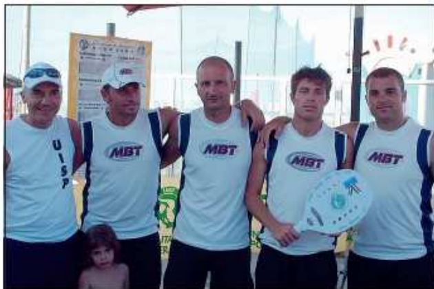
L'Equipe Romagna ha vinto nella categoria Amatori

In evidenza il Romagna Beach (secondi in coppa Eccellenza) e la squadra femminile U.M.A. (seconda in campionato ed in Coppa), il Beach Tennis Academy, il Covezzi Ascensori, il Bagno Italia Giuliana e il Bagno Adriatico.