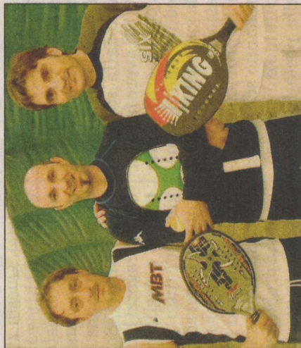
Ristorante L'ex B