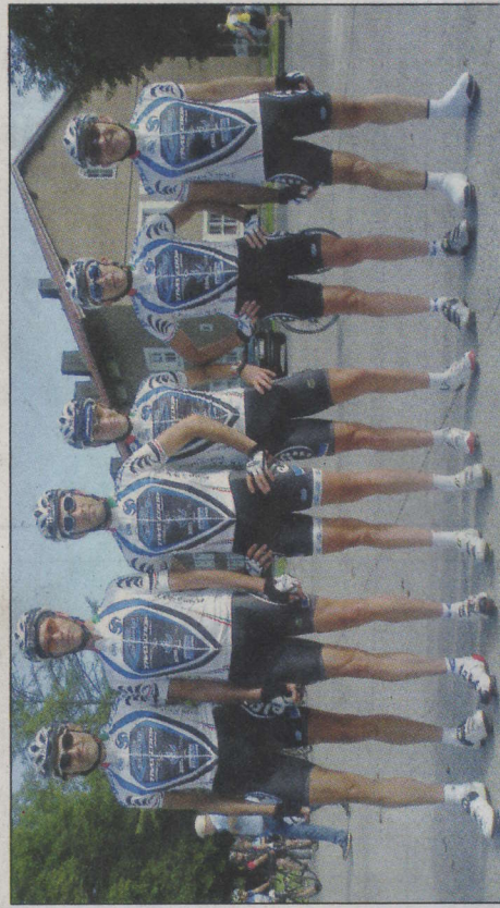
I sei portacolori del Team Outsiders che hanno affrontato la prova alpina

FORLÌ. Colpo di scena alla vigilia del campionato italiano Master di pattinaggio corsa. La gara che doveva assegnare le maglie tricolori over 40,50 e 60, non si farà. La “Forlì Roller”, società organizzatrice, ha preferito cancellare la prova a causa della mancata concessione di tutte le autorizzazioni. Un fulmine a ciel sereno a poche ore dal campionato. Domenica, invece, sarà regolarmente in calendario - tempo permettendo - il “Gran premio città di Forlì” al pattinodromo “Patriagnini” di viale Spazzoli.