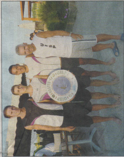
A sinistra la formazione vincitrice del “Palme beach team”; a destra i finalisti del “Covezzi Ascensori”

ne, caratterizzata da una prima fase a gironi ed una seconda a tabellone, ha avuto “Giovane Strada” ed il “Torakiki” come protagonisti iniziali. Proseguendo sotto il segno di un grande equilibrio di valori, il torneo designava in semifinale “Giovane Strada”, “Covezzi Ascensori”, “Palme Beach Team” e