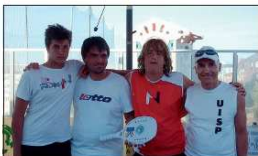
La Moviter ha chiuso seconda tra gli Amatori