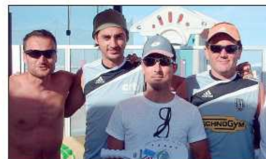
Romagna Beach secondo in Eccellenza