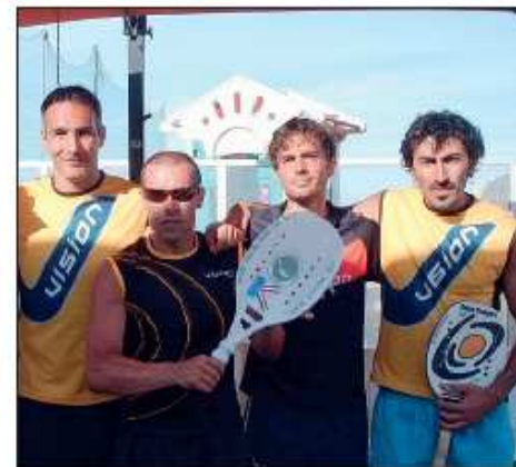
Domenica di festa anche per il Team Vision