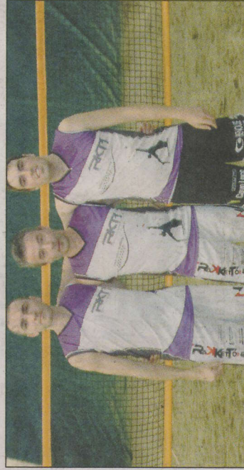
Beach Tennis Academy