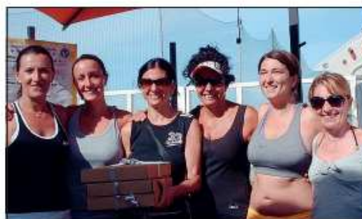
L'U.M.A. si è classificata seconda tra le donne