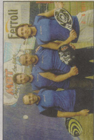
Kick Off 2