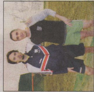
Compagnia del Cis